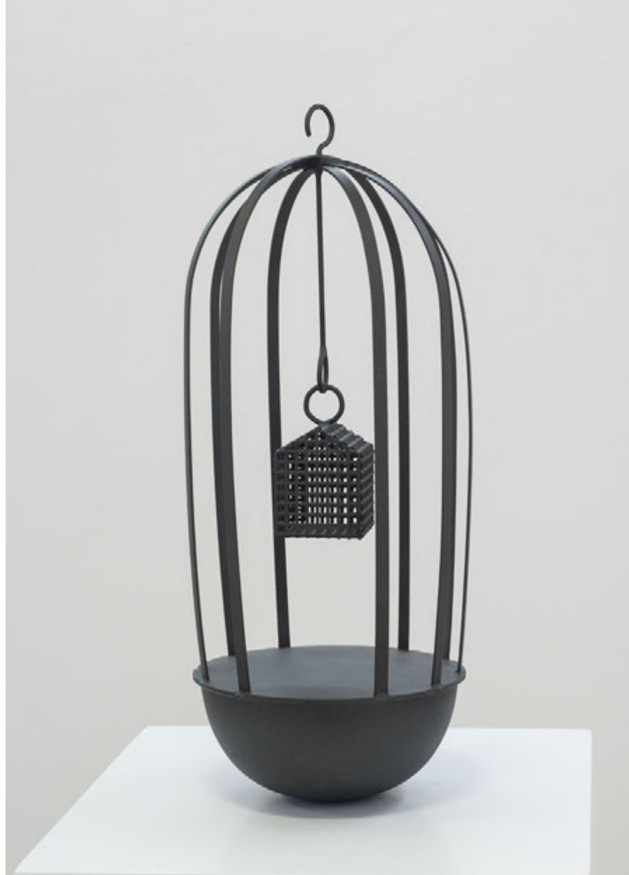
[PÁXINA SEGUINTE, DEREITA] Encruzilhadas , 2016 Ferro pintado 56 x 21 x 21 cm