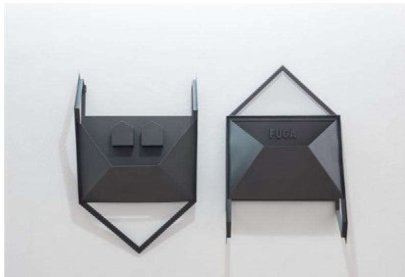
Fuga , 2016 Ferro pintado, madeira, resina 62 x 41 x 14 cm cada peza