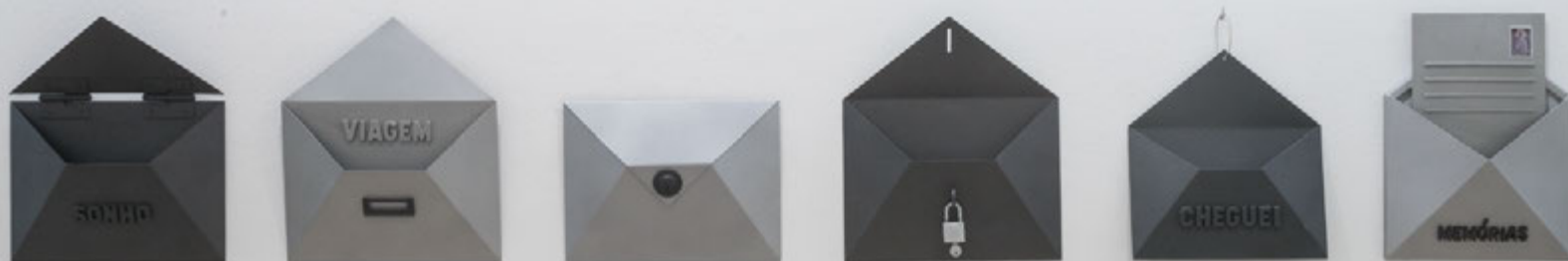
Sonho , 2016 Ferro pintado, resina 40 x 34 x 9 cm [DETALLE EN PÁGINA SEGUINTE]